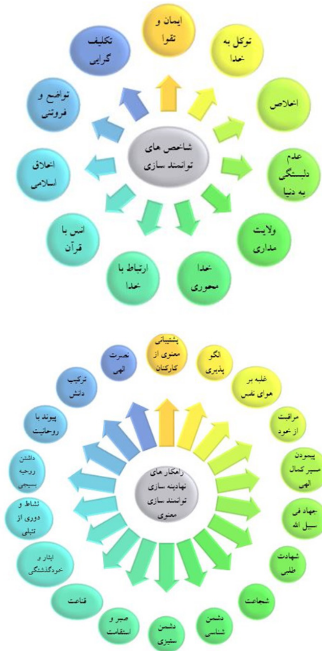
نمودار ۲- توانمندسازی معنوی بر اساس رهنمودهای رهبر معظم انقلاب اسلامی حضرت امام خامنه‌ای (مدظله‌العالی)

نقش توانمندسازی معنوی نیروهای مسلح در تحقق و نهادینه‌سازی جامعه اسلامی در بین کارکنان نیروهای مسلح از منظر امام خامنه‌ای (مدظله‌العالی)